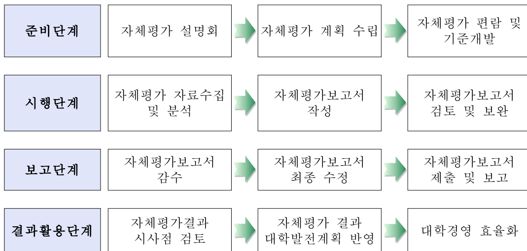
[그림 1] 자체평가 절차